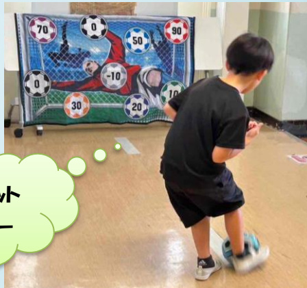
ターゲット サッカー