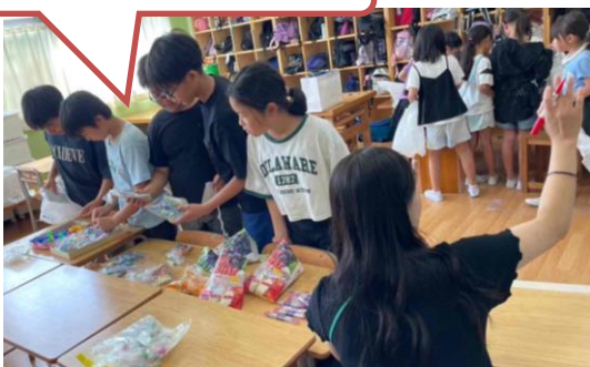
各7-ス4点以上の賞品